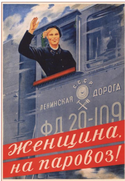
411. Дейнеко О. Женщина, на паровоз! 1939